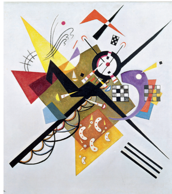
Vasili Kandinsky On White II , 1923. Óleo sobre tela, 105 x 98 cm.