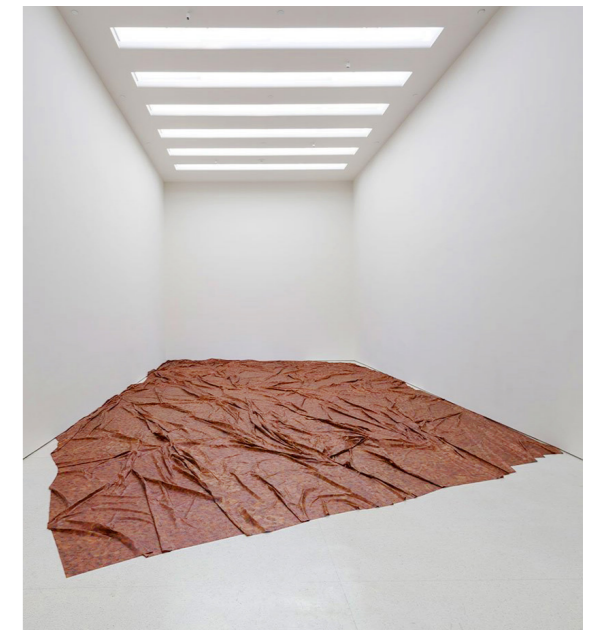
Doris Salcedo. A Flor de Piel , 2011 - 2012 Dimensiones variables. Pétalos de rosa e hilo.