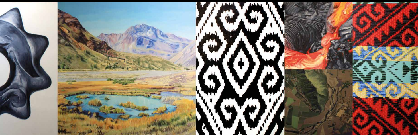
Conjunto 2 Cinco piezas de dimensiones variables, que en total miden: 900 x 150 cm. Óleo y acrílico sobre tela 2016